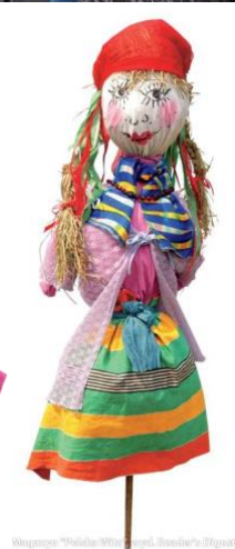
Wągrowo "Pałuka" Wiosna i Leto, Białucha's Długosz